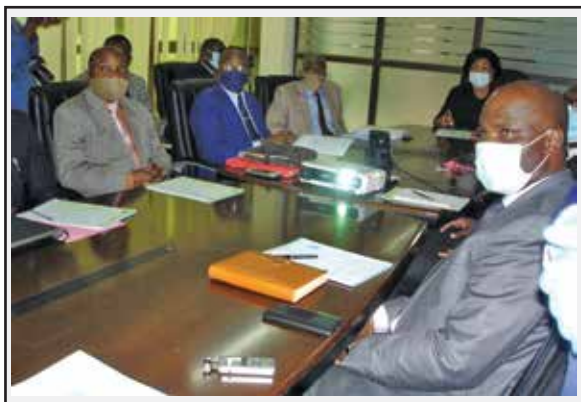
Pendant la séance du lancement du NIU par la ministre

Lancé en présence de Mme Yvonne Adelaïde Mougany, Ministre des Petites et moyennes entreprises, de l'artisanat et du secteur informel, au siège de l'ACPCE, le nouvel outil s'inscrit dans le cadre de l'intégration du projet NIU dans le dispositif de simplification des formalités au niveau de cette agence. C'est un service sécurisé qui consiste à réaliser des opérations à caractère économique. Le nouveau NIU sécurisé qui a fait l'objet d'une présentation «représente pour les contribuables et l'administration une grande évolution parce qu'il intègre tous les éléments qui seront nécessaires à ce que le déclarant, en ce qui nous concerne soit immatriculé avec beaucoup plus de sécurité et avec plus de traçabilité au niveau des administrations que nous sommes», selon Médard Yetela, Directeur général de l'Agence congolaise pour la création des entreprises.